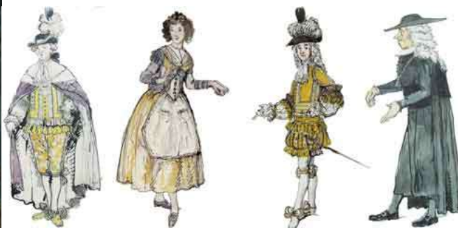
А.Н.Бенуа. Эскиз декорации. Эскизы костюмов к спектаклю «Женитьба Фигаро» П.Бомарше. 1926

Кузьма Сергеевич Петров-Водкин был приглашен в БДТ в 1923 году для постановки «Бориса Годунова» А.С.Пушкина. Как и многие художники начала XX века, Петров-Водкин тяготел к театру (в юности он увлекался символистской драматургией и сам писал пьесы в духе Метерлинка). Пространственные поиски, планетарность его мировоззрения резонировали с самыми острыми открытиями в области сценического пространства. В «Борисе Годунове» художник, казалось, наконец получил возможность перенести свою пространственную систему в театр, но спектакль так и не был осуществлен.