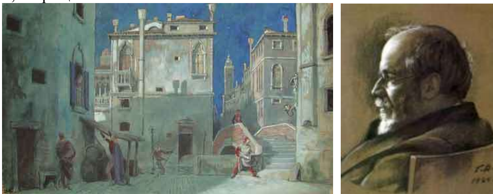
А.Н.Бенуа. Эскиз декорации к спектаклю «Венецианский купец» В.Шекспира. 1920. Портрет Александра Бенуа. 1924 г. Художник Г.С. Верейский.

В 1920 году А. Бенуа выступил в роли постановщика и художника спектакля «Венецианский купец». Оставаясь верным своей творческой манере, Бенуа создал восхитительное по живописности и красоте оформление в духе итальянского Возрождения. В «Венецианском купце» У.Шекспира Бенуа открыто провозглашал торжество поэзии над мраком жизни. Художник избирает главным действующим лицом спектакля лучезарную и романтическую Венецию. По замыслу Бенуа, ставшего и режиссером спектакля, Шейлок только «черное воспоминание, не совесть, а сны о какой-то мрачной, извращенной изнанке человечества».