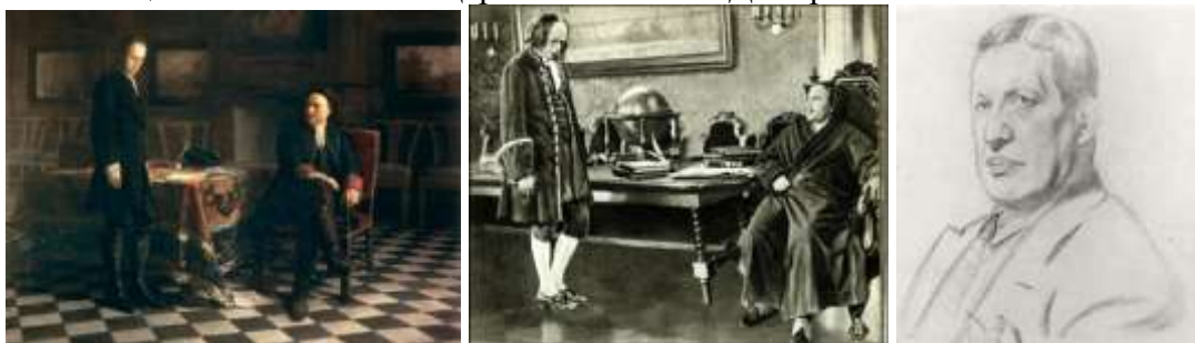
Николай Федорович Монахов. Рисунок Кустодиева 18 (30) марта 1875.

В «Слуге двух господ» К.Гольдони (1921) Бенуа обостряет прием стилизации, помещая венецианский мир века маски в театральном пространстве, где вместе сосуществуют нарядная, праздная публика, актеры, разыгрывающие жизнерадостную комедию о ловком плебее Труффальдино, жеманные танцоры, развлекающие зрителей между действиями. Здесь под музыку Скарлатти и Рамо артисты разыгрывали медлительные танцевальные пантомимические интермедии.