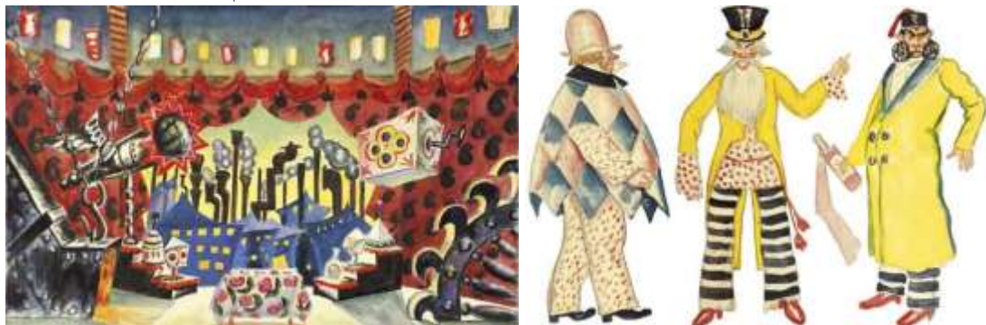
Б.М.Кустодиев. Слева эскиз декорации «Англия», справа эскиз костюмов халдеев к спектаклю «Блоха» Е.И.Замятина. 1926