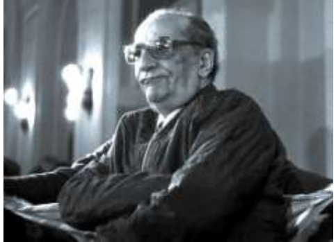
Борис Андреевич Бабочкин. Главный режиссер БДТ в 1938-1940.