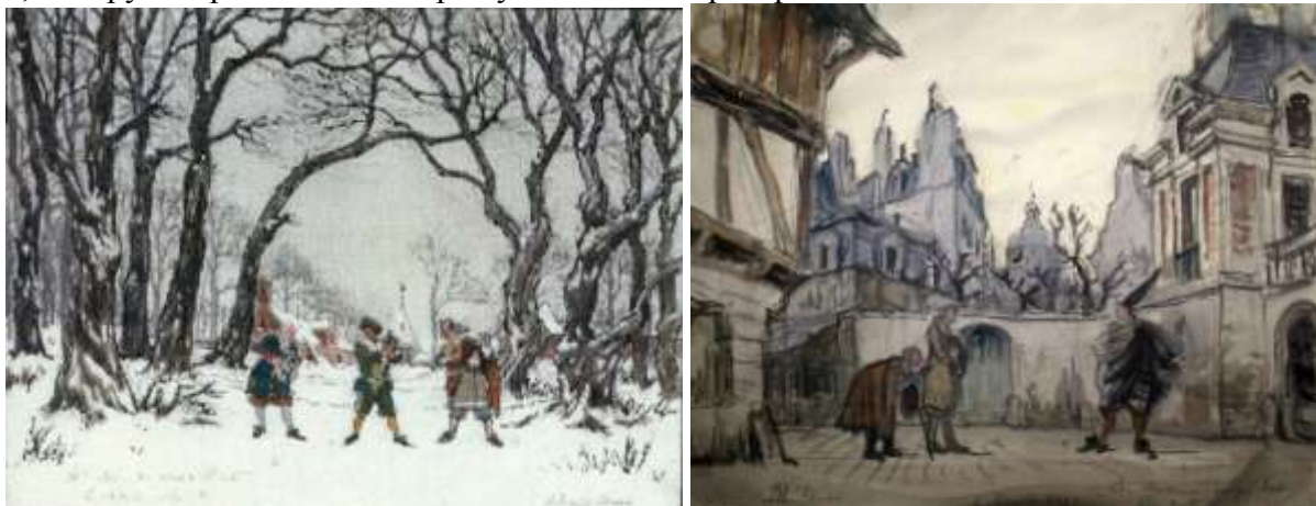
А.Н. Бенуа. Эскизы театральных декораций к комедии Ж.-Б. Мольера «Лекарь поневоле». 1921.

«Определить место БДТ в кругу новейших театральных течений – значит указать на ту роль, которую играл в этом театре художник-декоратор» А. А. Гвоздев