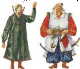
К.С.Петров-Водкин. Эскизы костюмов Бориса и Карелы к спектаклю «Борис Годунов» А.С.Пушкина. 1923