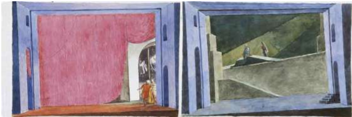
К.С.Петров-Водкин. Слева эскиз декорации «Замок воеводы Мнишека». Справа эскиз декорации «Ставка» к спектаклю «Борис Годунов» А.С.Пушкина. 1923.