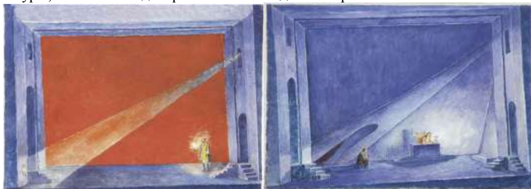
К.С.Петров-Водкин. Слева эскиз декорации «Царские палаты». Справа эскиз декорации «Келья в Чудовом монастыре» к спектаклю «Борис Годунов» А.С.Пушкина. 1923.

Макрокосм «Бориса Годунова» лаконичен и строг, он растворяет в своем пространстве все незначительное, почти не интересуясь предметным миром. Их место занимают пластические и цветовые символы. Так, Россия и Польша противопоставлены в спектакле пространственно и пластически. Открытому простору московских сцен противостоит замкнутый, сжатый объем картин польского акта. Строгому ритму абстрагированных горизонтальных и вертикальных плоскостей в русском пространстве контрастны криволинейные изгибы асимметричных драпировок, круглящиеся линии архитектуры, изысканная декоративность западного мира.