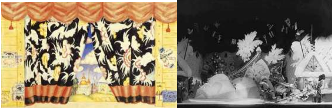
Б.М.Кустодиев. Эскиз занавеса к спектаклю «Блоха» Е.И.Замятина. 1926 Сцена из спектакля «Блоха» Е.И.Замятина. 1926